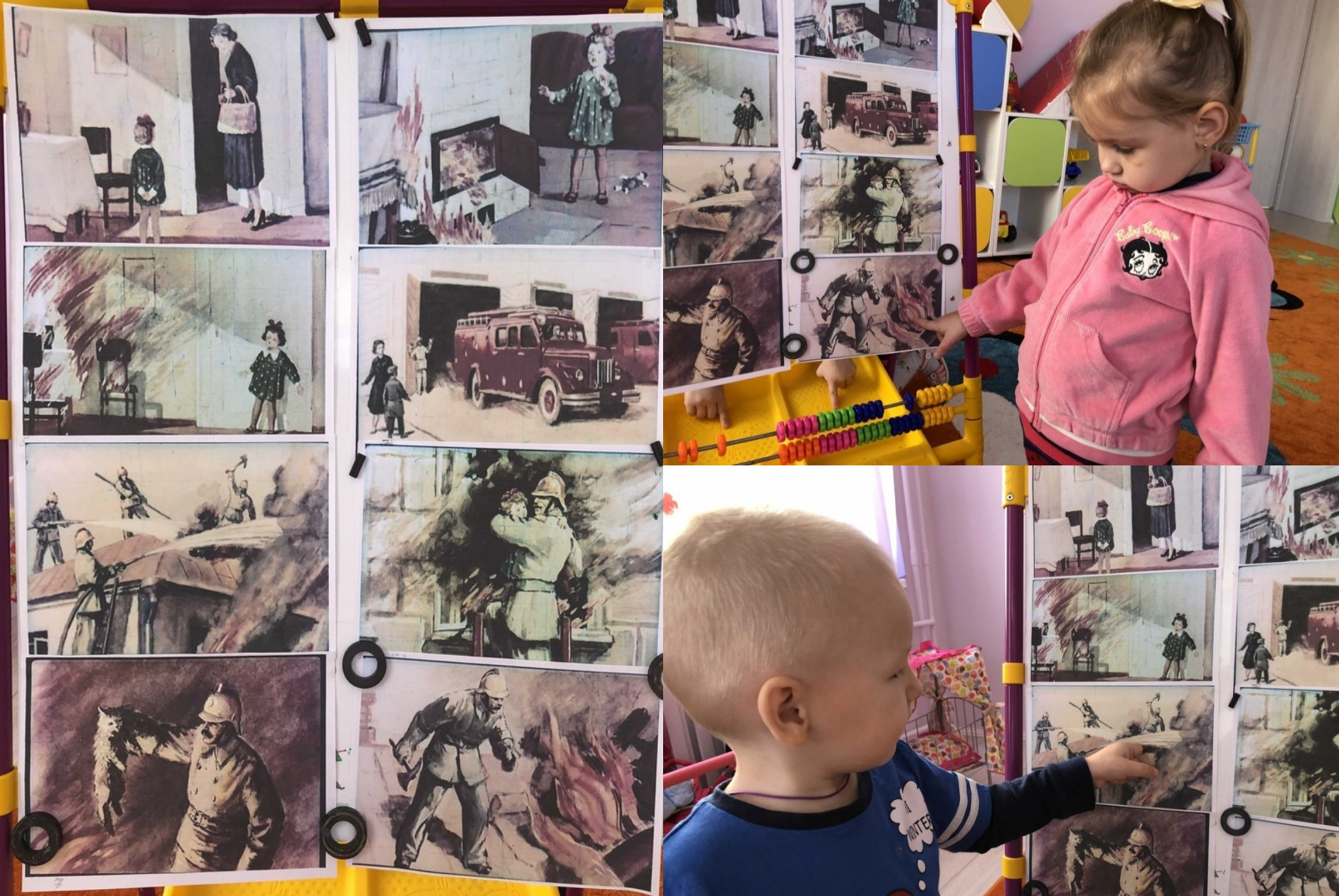
Ответы детей на вопросы по содержанию