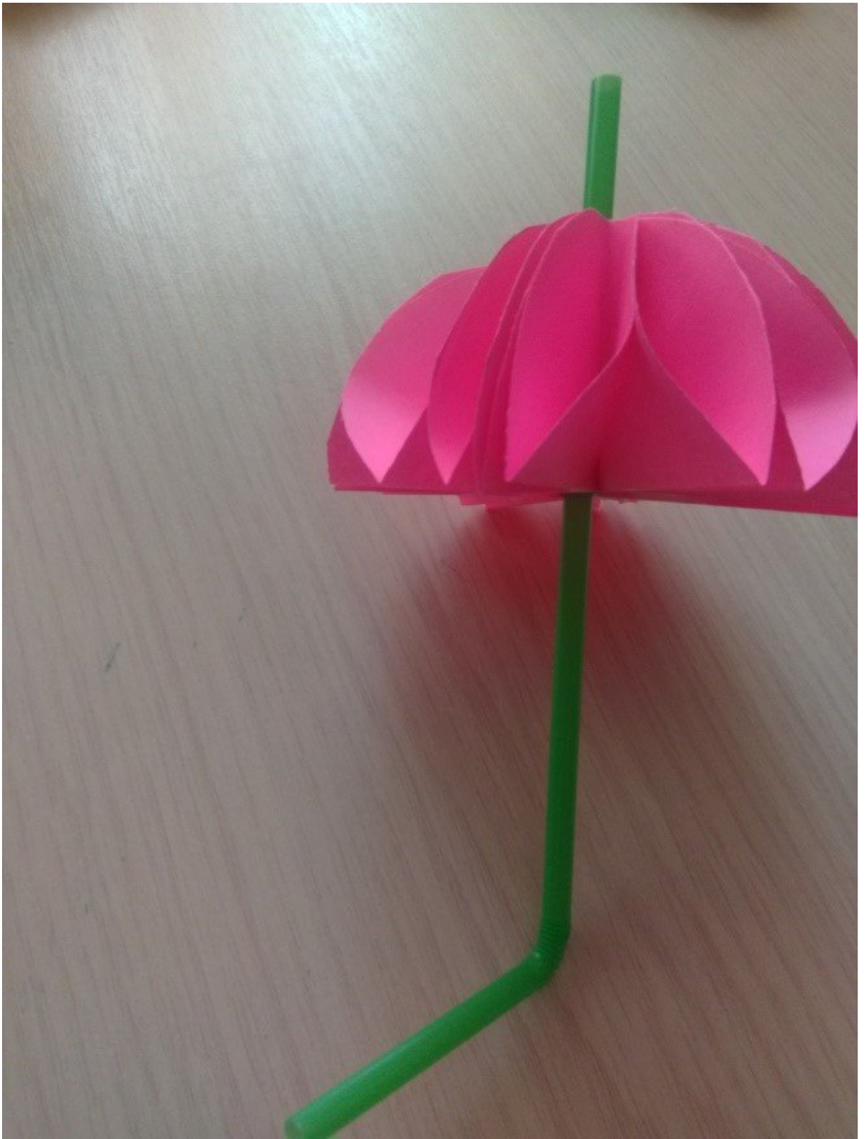
Наш зонтик из бумаги готов.