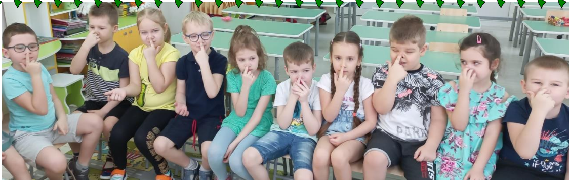
Прыг на носик, на плечо