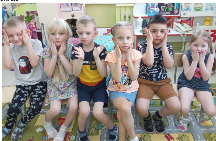
Нежно согревает (широко раскрыть глаза)