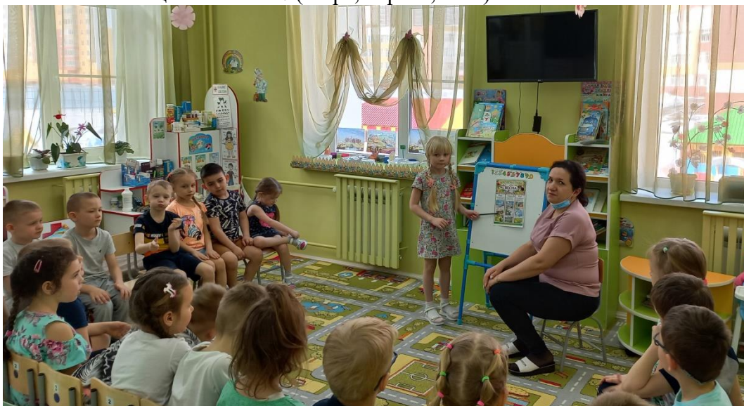
Работа по картине, развитие связной речи.