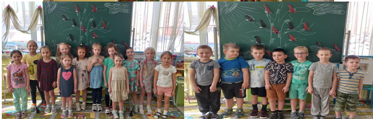
Коллективная работа «Грачи прилетели»