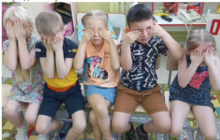
А солнышко играет: Щёчки тёплыми лучами