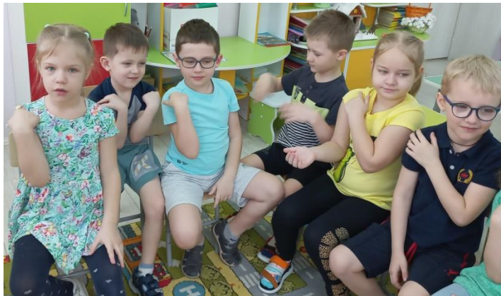
Ой как стало горячо! Прыг на лобик и опять На плече давай скакать (следить взглядом за движениями пальца) Вот закрыли мы глаза (ладонями)